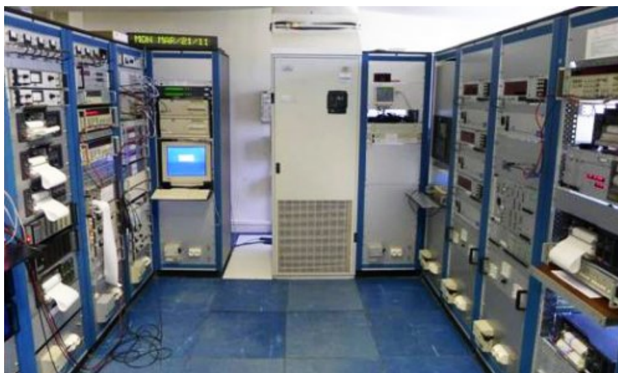
Salle de contrôle du temps légal français, à l'Observatoire de Paris

Dans la nuit du 30 juin au 1er juillet 2012, juste avant 0h 00min 00s UTC, une seconde supplémentaire vient s'ajouter au temps légal de tous les pays du monde. En France, avec l'heure d'été, cette seconde intercalaire interviendra le 1er juillet au matin : les horloges afficheront 1h 59min 59s, puis 1h 59min 60s et enfin 2h 00min 00s. La dernière minute aura alors duré 61s. L'ajout de cette seconde, corrélé aux variations de la rotation de notre planète, est décidé au niveau mondial à l'Observatoire de Paris au sein de son laboratoire Systèmes de Référence Temps-Espace - SYRTE1. Responsable du temps légal Français, celui-ci est aussi chargé d'introduire cette seconde intercalaire dans notre pays.