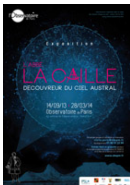
L'Abbé La Caille, découvreur du ciel austral

L'Observatoire de Paris présente exceptionnellement deux expositions dans son bâtiment historique à Paris, retraçant deux histoires exceptionnelles de mesures du ciel menées à près de trois siècles d'intervalle... à découvrir jusqu'au 28 mars 2014.