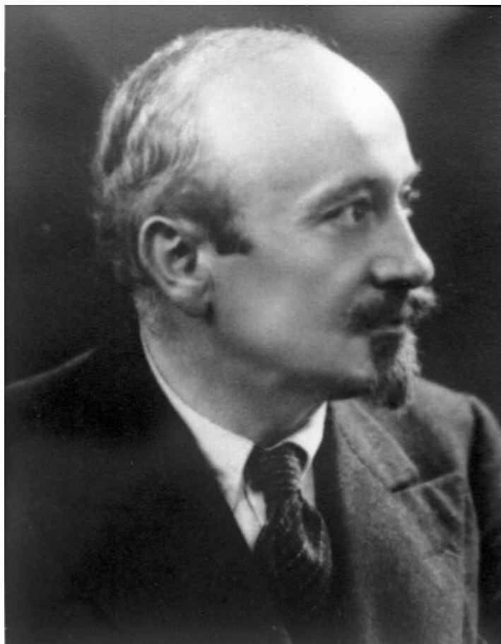
portrait photographique d'Ernest Esclangon Observatoire de Paris

Fin 1929 à l'Observatoire de Paris, son directeur Ernest Esclangon (1876-1954) est confronté à la demande croissante du public de disposer de l'heure « exacte » : l'unique ligne téléphonique de l'établissement est trop souvent saturée. Il envisage alors une réponse entièrement automatique : une horloge parlante.