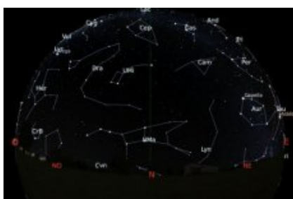
Carte du ciel en direction nord - octobre 2019

Ces cartes du ciel montrent les étoiles brillantes et les planètes visibles dans le ciel de l'hémisphère nord, vers l'horizon sud et vers l'horizon nord, pour le 15 octobre 2019 (23h). Le trait vertical correspond à la projection sur le ciel du méridien du lieu. L'arc de cercle rouge sur l'horizon sud représente l'écliptique (lieu de la trajectoire apparente du Soleil durant l'année).