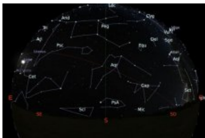
Carte du ciel en direction sud - octobre 2019