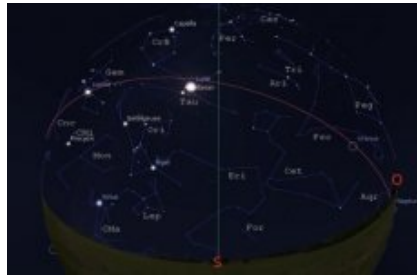
Carte du ciel en direction sud - Décembre 2013