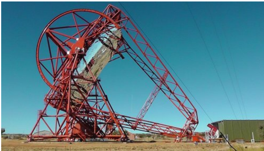
Le plus grand télescope

Figures : Photos du site, du télescope et de son abri, et d'une gerbe de particules vue simultanément par le télescope H.E.S.S. II (centre) et par les télescopes H.E.S.S. I (côtés). La couleur indique l'intensité de la lumière. Les images illustrent les grandes sensibilité et résolution spatiale de H.E.S.S. II. Les caméras de H.E.S.S. I sont montrées avec une taille réduite. Cliquer sur les images pour les agrandir