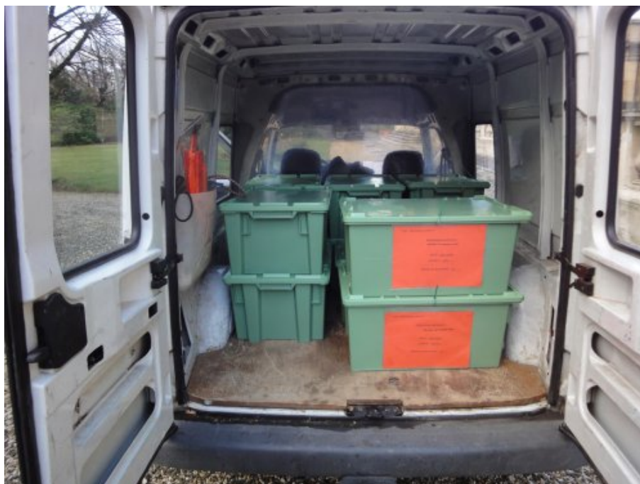
Le premier train de numérisation (80 000 pages) prêt à partir à la BnF fin 2012

ont travaillé sur un an et demi à raison d'environ une demi-journée par semaine. La BnF a réalisé une vidéo présentant ce partenariat avec l'Observatoire de Paris.