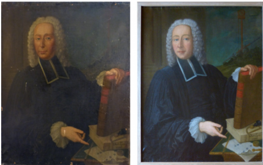
Le portrait de Grandjean de Fouchy avant et après restauration

Au terme d'une intervention d'environ un mois réalisée dans l'atelier de la restauratrice Elisabeth Chauvrat, le tableau est revenu littéralement transformé comme on le voit ci-dessous :